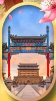
ถนนคนเดินเจียมเหมิน