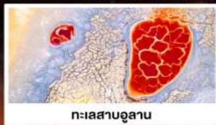
ทะเลสาบอูลาน