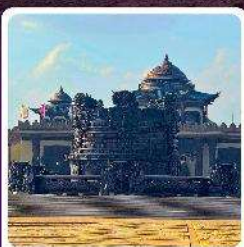
ศูนย์วัฒนธรรมหยวนหยิว