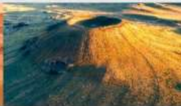
ภูเขาไฟอูลันฮาตา

*ทางบริษัทฯ ขอสงวนสิทธิ์ในการสลับโปรแกรมทัวร์ตามความเหมาะสมขึ้นอยู่กับสถานการณ์หน้างาน โดยคำนึงถึงผลประโยชน์ของลูกค้าเป็นสำคัญ