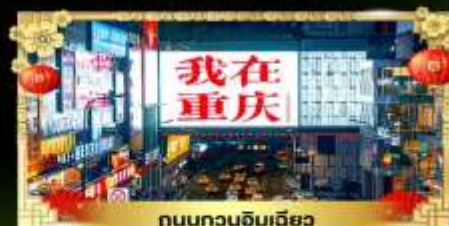
ถนนทวงฉิมเฉียว