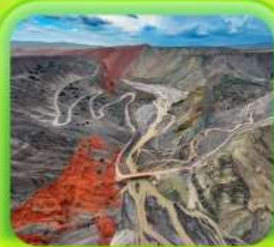
"แกรนด์แคนยอนคู่ชานโจ้ว"

ซินเจียงเหนือ ทะเลสาบโซลิมู่ "น้ำตาหยดสุดท้ายของแอตแลนติก" • กุ้งหนุ่ยอาราตี กุ้งดอกไม้เทียนซาน • ผ่านชมสะพานกั๋วจื่อโกว • ถนนหลิวซิงเจียง • ตลาดต้าปาจา