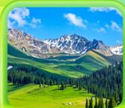
"กุ้งหนุ่ยอาราตี"