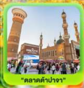
"ตลาดต้าปาจา"

ซินเจียงเหนือ ทะเลสาบโซลิมู่ "น้ำตาหยดสุดท้ายของแอตแลนติก" • กุ้งหนุ่ยอาราตี กุ้งดอกไม้เทียนซาน • ผ่านชมสะพานกั๋วจื่อโกว • ถนนหลิวซิงเจียง • ตลาดต้าปาจา