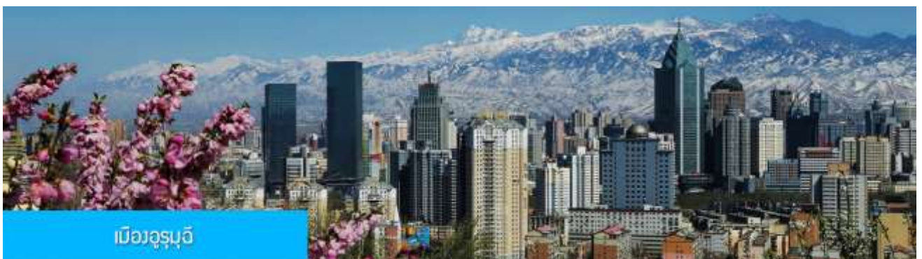
เมืองวูรูมูฉี

พักที่ MERCURE HOTEL โรงแรมระดับ 4 ดาวท้องถิ่นหรือเทียบเท่าในเมืองวูรูมูฉี