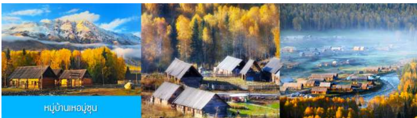
หมู่บ้านเหม่อซุน

วันที่สาม เมืองปู้เอ้อจิน-หมู่บ้านเหม่อซุน -บ้านชนเผ่าถูหว่า-เมืองเจี๋ยเต็งยี