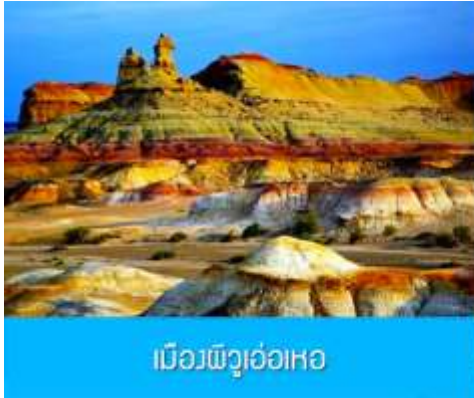
เมืองพิวูเอ้อเหอ

พักที่ XI BU WU ZHEN HOTEL ระดับ 4 ดาวท้องถิ่นหรือเทียบเท่าในเมืองวูเอ้อเหอ