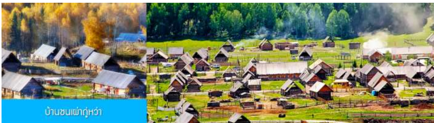
บ้านชนเผ่าถูหว่า

หลังอาหารนำท่านเดินทางสู่ หมู่บ้านเหม่อซุน (ระยะทาง 110 กม ใช้เวลาเดินทางราว 2 ชั่วโมง) นำท่านเที่ยวชม หมู่บ้านเหม่อซุน 禾木村 หมู่บ้านโบราณที่ขึ้นชื่อด้วยทัศนียภาพที่สวยงามท่ามกลางความสงบ เป็นชุมชนของชนเผ่าถูหว่าที่เป็นชนพื้นเมืองในเขตมองโกเลีย ที่เป็นชนกลุ่มน้อยที่เก่าแก่ที่สุดในจีนพำนักอาศัย อยู่ หมู่บ้านแห่งนี้ ตั้งอยู่ในเขตอุทยานคานาสือ ทางฝั่งตะวันตกเฉียงใต้ของเทือกเขาอัลไต หมู่บ้านนี้ได้รับการ ขนานนามว่าเป็นหมู่บ้านชนเผ่าที่มีเอกลักษณ์โดดเด่น ถูกจัดลำดับเป็นหนึ่งในหกหมู่บ้านโบราณที่ดีที่สุด และ หนึ่งในแปดสถานที่ถ่ายทำภาพยนตร์ยอดเยี่ยมของจีน มีแม่น้ำเหม่อไหลผ่านหมู่บ้าน ด้วยทัศนียภาพที่สวยงาม ท่ามกลางความสงบแห่งธรรมชาติ หมู่บ้านแห่งนี้มีช่างภาพ นักวาดเขียนและนักท่องเที่ยวต่างมาเยือนอย่างไม่