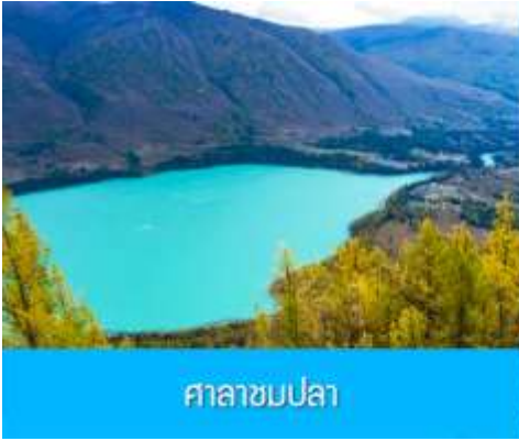
ศาลาชมปลา