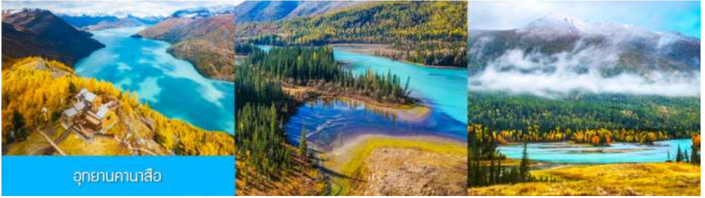
อุทยานคานาสีอ