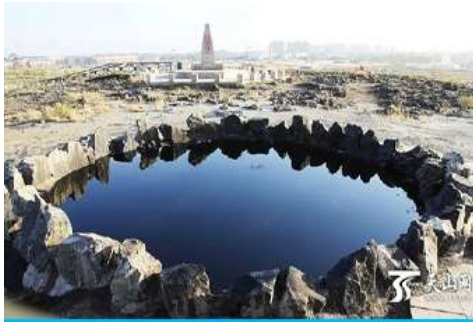
บ่อน้ำมันสีดำ

ระหว่างทางแวะรับประทานอาหารกลางวัน ณ ภัตตาคาร (เมนูอาหาร 80 หยวน/หัว) (11)