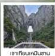
เซาเทียนเหมินซาน

ฉลองเที่ยวบินปฐมฤกษ์ เก็บครบทุกไฮไลต์!! วันที่ 10 พฤษภาคม 2569 กรุงเทพฯ - ดางซา (จางเจียเจีย)