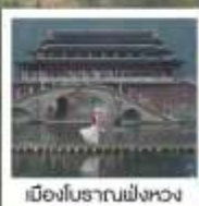
เมืองโบราณฟังหวง