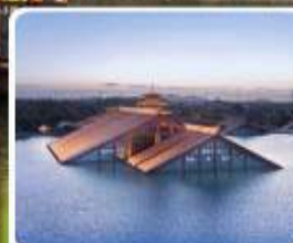
พิพิธภัณฑ์ไดน้ำกวงฟูหลิน