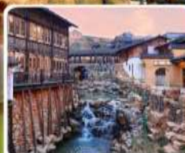
เมืองโบราณเหย้าหู