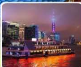
ส่องเรือแม่น้ำหวงผู่