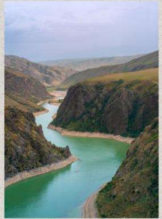
แกรนด์แคนยอนคุโคซู