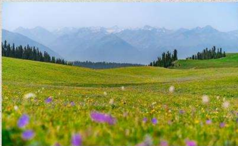
ทุ่งหญ้าคารา