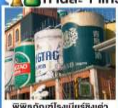
พริตแอมบุชที่โรงเบียร์ชิงต้า