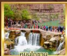
หยุ่นโกซาน