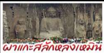
ผาแกะสลักเสลงเอเมิน

เที่ยวครบ 4 มรดกโลก ถ้ำหลงเหมิน - สุสานจิ๋มซีฮ่องเต้ - วัดส่าหลิน หมู่บ้านไต้คินสามโจ้ว - หมู่บ้านทิวเสี่ยงซุน