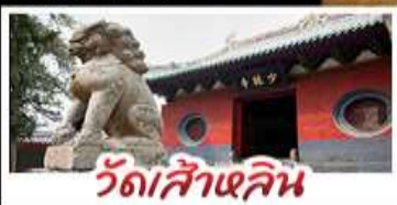
วัดส่าหลิน