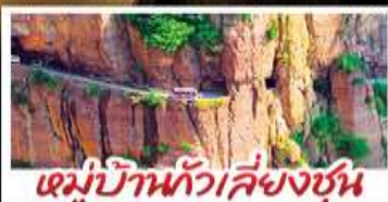
หมู่บ้านทิวเสี่ยงซุน