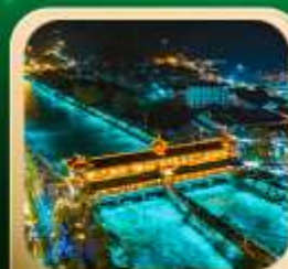
“สะพานหนานเฉียว น้ำตาสีฟ้า”