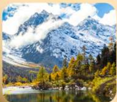
“ปี่เผิงโกว”

ชมธรรมชาติ 2 อุทยานขึ้นชื่อ อุทยานภูเขาสี่ดรุณี + อุทยานปี่เผิงโกว สะพานหนานเฉียว • ถนนคนเดินไก่อู๋หลี่ + ซุนซีลู่ + Pop Mart • ดงเจียวจี้