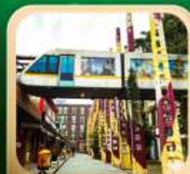
“ดงเจียวจี้”