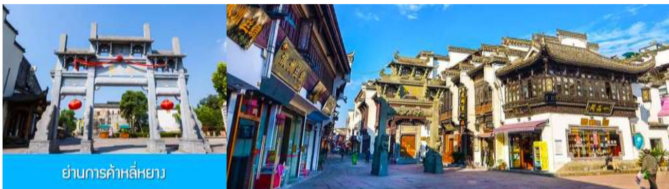
ย่านการค้าลี่หยาง

เที่ยง อิสระอาหารมื้อกลางวัน ( ท่านสามารถเลือกชิมอาหารพื้นเมืองในระแวกโรงแรมได้ตามอัธยาศัย )