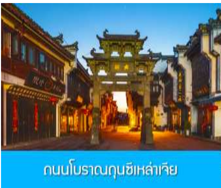
ถนนโบราณฉุนซีเหล่าเจีย

หลังอาหารนำท่านนำท่านเที่ยวชม หมู่บ้านโบราณหงซุน 宏村 หมู่บ้าน โบราณจีนชื่ออายุกว่า 800 ปีที่ได้รับ การขึ้นทะเบียนจาก UNESCO ชมบ้านเรือน โบราณกว่า 140 หลัง ที่สร้างขึ้นในยุคราชวงศ์หมิงและราชวงศ์ ชิง ที่ยังอยู่ในสภาพที่สมบูรณ์ นำท่านเที่ยวชม และเช้คอิน ณ จุดเช้คอินต่าง ๆ ภายในหมู่บ้าน อาทิ บึงน้ำ พระจันทร์ ทะเลสาบหนานหู โรงเรียนหนานหู หอบรรพบุรุษ คลองน้ำหงซุน ต้นไม้โบราณ ฯลฯ