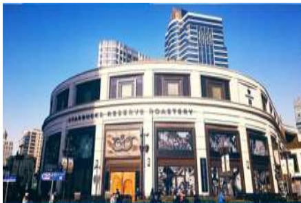
Starbuck Reserve Roastery

เที่ยง รับประทานอาหารกลางวัน ณ ภัตตาคาร *เมนูเดียวหลงเป่า (2)