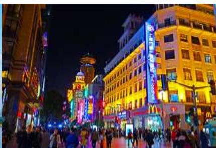
ถนนคนเดินนานกิง