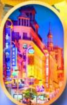
ถนนหนานกิง