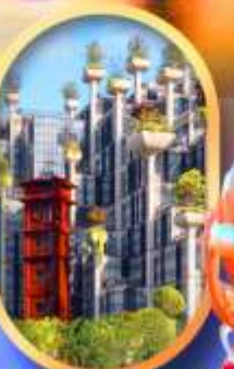
อาคาร1,000ต้นไม้