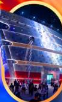
เรืออะพลุยส์