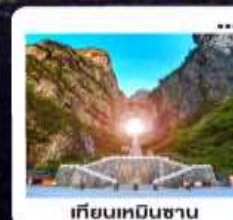
เกียนหมินซาน