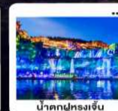
น้ำตกฟูหลงเจิน

"มหัศจรรย์...จางเจียเจีย" | ดินแดนแห่งขุนเขาและสายน้ำ "เขาเกียนหมินซาน" | ประตูล่องเรือ...ทำกายศรึกษา 999 ชั้น | บั้งรถไฟความเร็วสูง สัมผัสความสวยงามตระการตา "อุทยานอวตาร" | ส่องล่องกลางขุนเขา...ดั่งภาพฝันในห้วงนเจียเจีย | ช็อปปัง POPMART "เมืองโบราณ"ฟูหลง" หยูคเวลา ณ เมืองบนบ้านน้ำตก... | "เฟิ่งหวง" ส่องเรือชมชีวิตริมแม่น้ำถิวเจียง "นครฉางซา" ปิดท้ายความทันสมัย