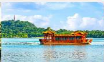
ล่องเรือทะเลสาบหลิวเยว่หู