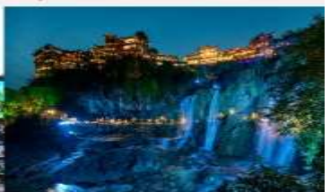
ฟูหรงเจิน

*ทางบริษัทฯ ขอสงวนสิทธิ์ในการสลับโปรแกรมทัวร์ตามความเหมาะสมขึ้นอยู่กับสถานการณ์หน้างาน โดยคำนึงถึงผลประโยชน์ของลูกค้าเป็นสำคัญ