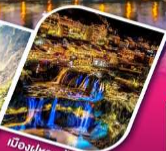
เมืองฝูหลงจิ้น