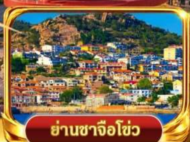
ย่านซาจื่อไซ่