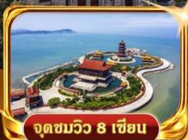
จุดชมวิว 8 เขียน