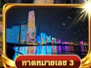
หาดหมายเลข 3