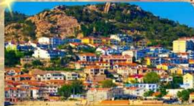
ถ่ายภาพซาจือໂຂ່ວ