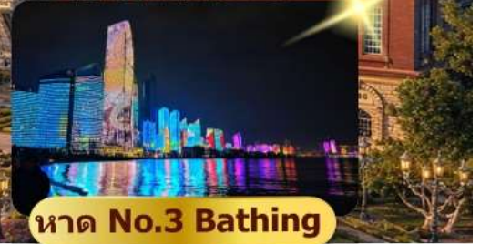
หาด No.3 Bathing

เมนูพิเศษ อาหารซีฟู้ด 6 วัน 4 คืน เดินทาง : พ.ค. – มิ.ย. 69