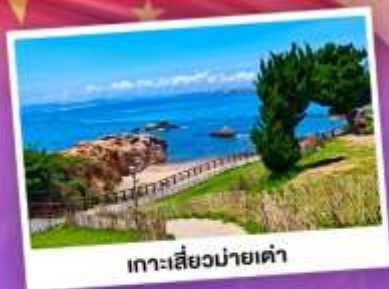
เกาะเลี้ยวม่ายเต๋า

เที่ยวชิงเต๋า เมืองทะเลสุดชิล ครบทั้งกิน เที่ยว ถ่ายรูป