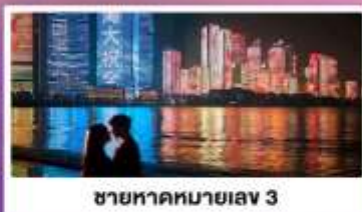
ชายหาดหมายเลข 3