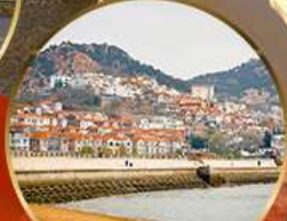
ซาจื่อไห่