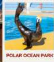
POLAR OCEAN PARK