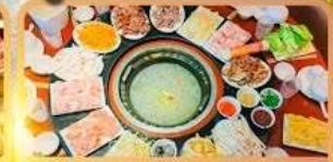
สุกี้เด็ด