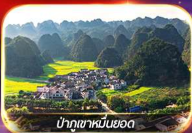
ป่าภูเขาหมื่นยอด