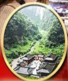
อุทยานหลุมฟ้า สะพาน สวรรค์