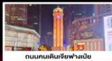
ถนนคนเดินเจียฟางเป็ย