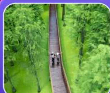
"ป่าสนชิงซาน"