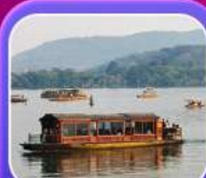
"ล่องเรือทะเลสาบซีหู"