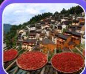
"หมู่บ้านทองหลิง"

หุบเขาเทวดาฉงชานอู่ หมู่บ้านที่ตั้งอยู่ริมหน้าผา • หมู่บ้านโบราณทองหลิง ป่าสนน้ำชิงซาน • ล่องเรือทะเลสาบซีหู • ถนนโบราณตุ๋นจ้อ • ชมแสงสีที่ อู่หนี่โจว