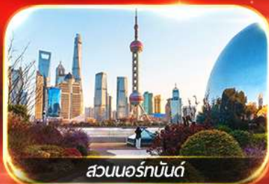
สวนนอร์มัลด์