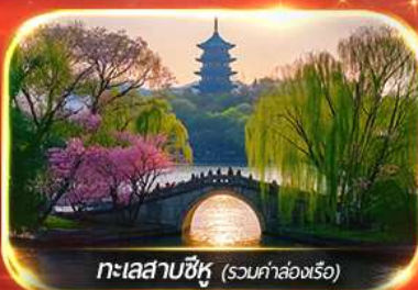
ทะเลสาบซีหู (รวมค่าล่องเรือ)