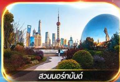
สวนออร์ทันด์