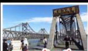
ตามองตัวนเอียว