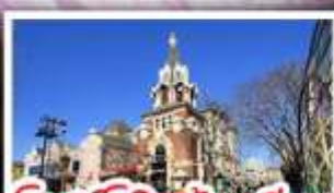
โบสถ์โกธิคตาเหลียน