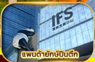
แพนด้ายักษ์ป็นติก