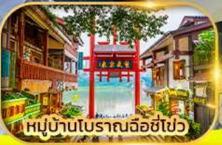
หมู่บ้านโบราณฉือชี่ไฉว