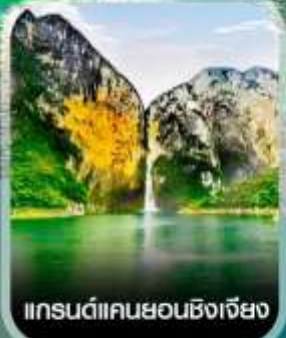
แกรนด์แคนยอนซิงเจียง