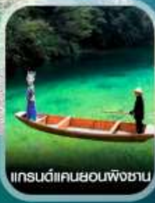
แกรนด์แคนยอนผิงชาน

คอนเฟิร์มออกเดินทาง ทุกพีเรียด 2 ท่านขึ้นไป