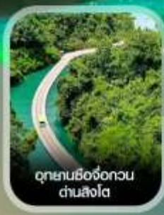
อุทยานซีงจื่อกวน ด่านสิงโต