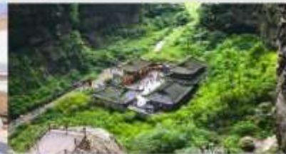
อุทยานแห่งชาติบ่อหลุมฟ้า

*ทางบริษัทฯ ขอสงวนสิทธิ์ในการล้บโปรแกรมทัวร์ตามความเหมาะสมขึ้นอยู่กับสถานการณ์หน้างาน โดยค่านั่งถึงผลประโยชน์ของลูกค้เป็นสำคัญ