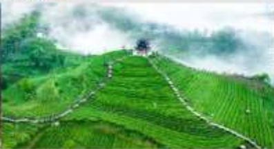
ไร้ชาอู่เจียโต