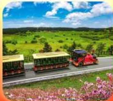
"อุทยานเขานางฟ้า"

บินตรงลงชิง • อุ้หลง หลุมฟ้าสะพานสวรรค์ • ระเบิดยงแก้ว • อุทยานเขานางฟ้า หงหยาดัง • นั้งรถไฟทะลุคิก • ล่องเรือชมฉงชิ่งยามค่ำคืน • ศาลาประชาคม (ด้านนอก) มรดกโลกผาหินแกะสลักต้าจู้ • เมืองโบราณสี่ปาตี้ • วัดหลิวฮั่น • ตักตะเกียบ