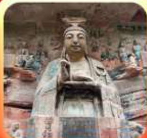
"ผาหินแกะสลักต้าจู้"