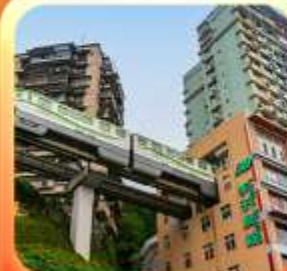
"นั้งรถไฟทะลุคิก"