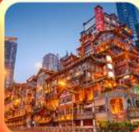
"ล่องเรือชมวิวหงหยาดัง"