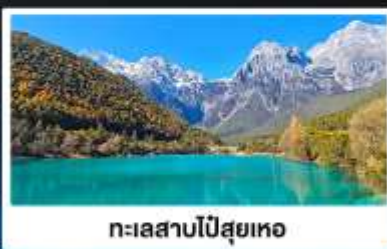
ทะเลสาบไป๋สยู่เหอ