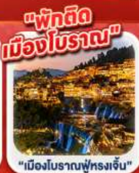
"เมืองโบราณฟู่หลงเจิ้น"