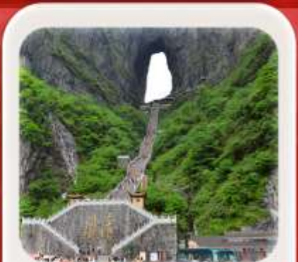
"กำประตูลั่วหวู่"