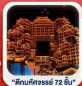
"ตึกมหัศจรรย์ 72 ชั้น"