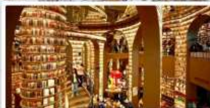
ร้านหนังสือจงซูเก๋อ

เดินทางโดย: สายการบินเฉิงตูแอร์ไลน์ (EU)