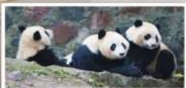
หุบเขาแพนด้า