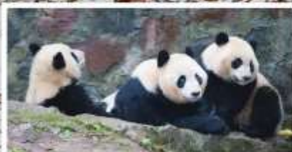
หุบเขาแพนด้า