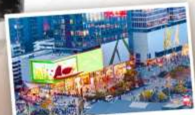
ถนนโทกู่หลี่หลิน