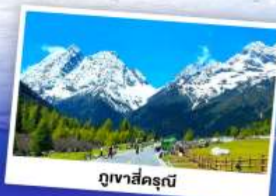
ภูเขาสีครุณี