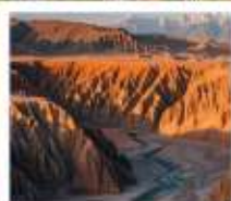
แกรนด์แคนยอนดูซานจือ