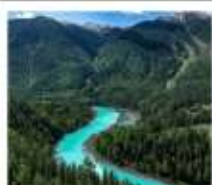
อุทยานคานาสือ