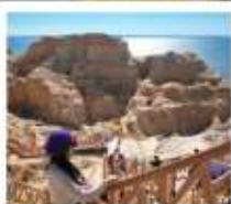
เขตบิศาจทะเล