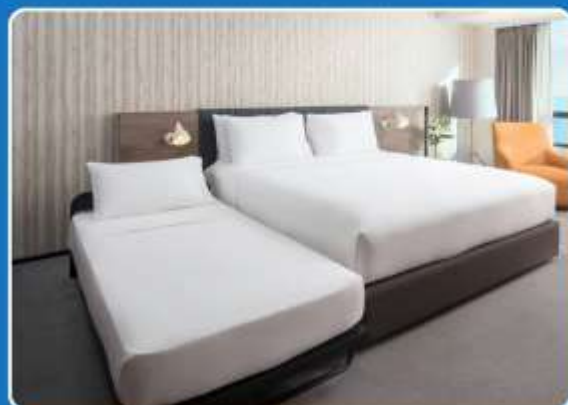
👤👤+👤 TRIPLE (TRP)

**รูปภาพห้องพักเป็นเพียงภาพสื่อถึงประเภทของเตียงเท่านั้น ไม่ใช่ภาพห้องพักจริงสำหรับการเข้าพัก**