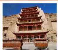
ท่าม่อเกา