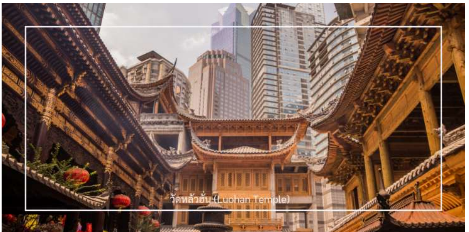
วัดหลัวฮั่น (Luohan Temple)

นำท่านเที่ยวชม วัดหลัวฮั่น (Luohan Temple) หรือที่เรียกว่า "วัดอรหันต์" เป็นวัดที่มีชื่อเสียงในเมืองฉงชิ่ง มีประวัติศาสตร์ยาวนานและมีความสำคัญในด้านศาสนาพุทธ วัดหลัวฮั่นมีพระพุทธรูปและรูปปั้นอรหันต์จำนวนมาก ซึ่งเป็นที่เคารพนับถือของผู้มาเยือน นอกจากนี้ยังมีบริเวณที่ให้ผู้เข้าชมสามารถทำบุญและสวดมนต์