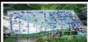
ระเบิดงงแก้วอุโมงค์