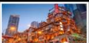
ตลาดแดงเซาเต็ง