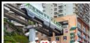
สถานีรถไฟทะเลสาบ

ดงซิ่ง - อุโมงค์ - หงหยาดิ่ง อุทยานเจานางฟ้าดงซิ่ง สถานีรถไฟทะเลสาบ หลุมฟ้าสามสะพานสวรรค์