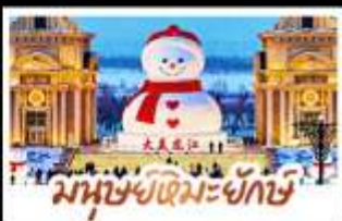
มนุษย์หิมะยักษ์