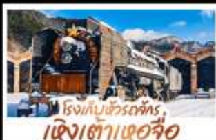
รถไฟความเร็วสูง เจียงเตาเซอจื่อ