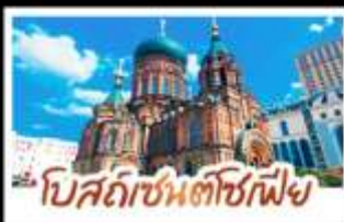
โบสถ์อัครทูตเซนต์ปีเตอร์