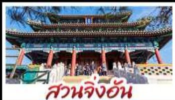
สวนจึงอัน