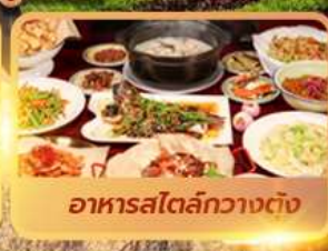
อาหารสลัดกวางต้ง