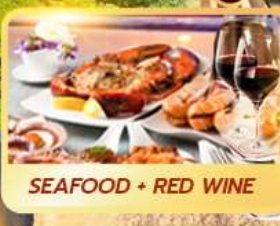
SEAFOOD + RED WINE