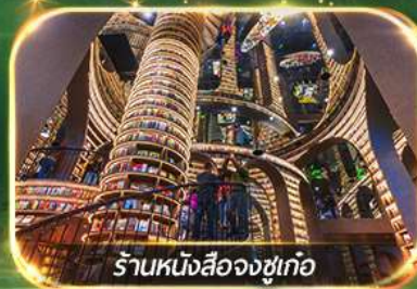
ร้านหนังสือจางชู่เกอ

เที่ยวชม 2 อุทยาน ปี้เฟิงโกว & จิวจ้ายโกว (รถเหมา)