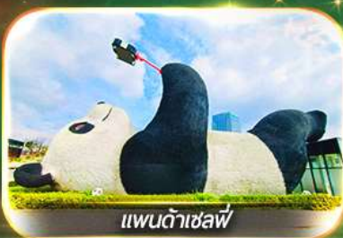
แพนด้าเซลฟ์