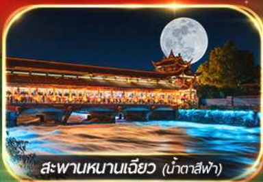
สะพานหนานเจียว (น้ำตาสีฟ้า)