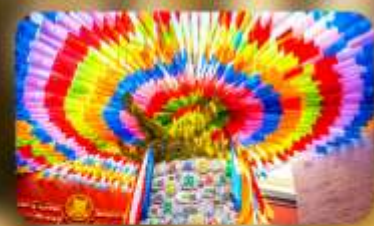
วัดลามะ-กว้างเหริน