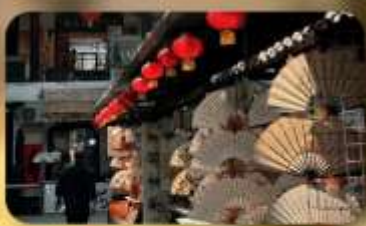
ถนนโบราณซูหยวนเหมิน