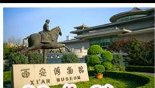
พิพิธภัณฑ์ซีอาน