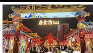
ถนนคนเดินต้าถิง