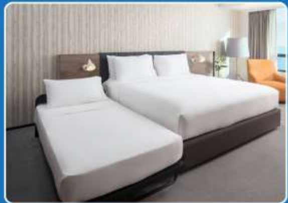
👤👤+👤 TRIPLE (TRP)

**รูปภาพห้องพักเป็นเพียงภาพสื่อถึงประเภทของเตียงเท่านั้น ไม่ใช่ภาพห้องพักจริงสำหรับการเข้าพัก**