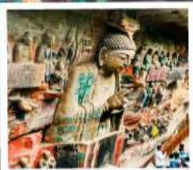
พาหินแกะสลักต้าจู้