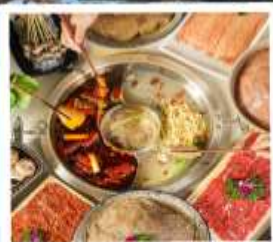
หม้อไฟหมาล่า